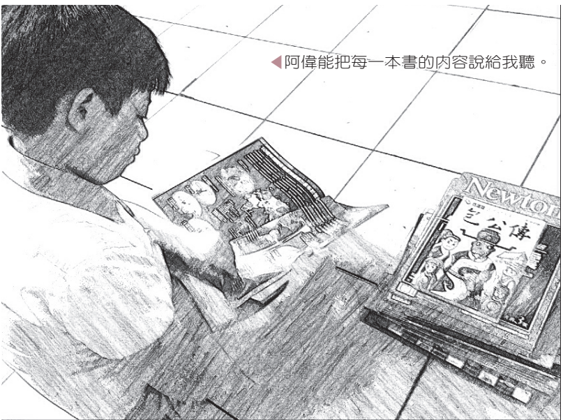
◀ 阿偉能把每一本書的內容說給我聽。