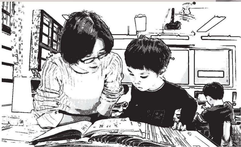
▲我跟小承相處的每一日，都耐心陪伴。