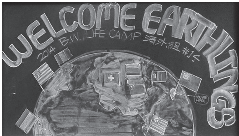
▲大專營走向國際化。

舉辦了十多年的大專青年生命成長營，已讓許許多多學員透由心靈提升，立志、追夢，讓生命最高。然而這樣合一群志同道合的善友，綻放生命光采，共創金碧輝煌時代的，並未局限於台灣的青年學子，「福智青年」的青春活力、智慧遠見開始向全世界散播！