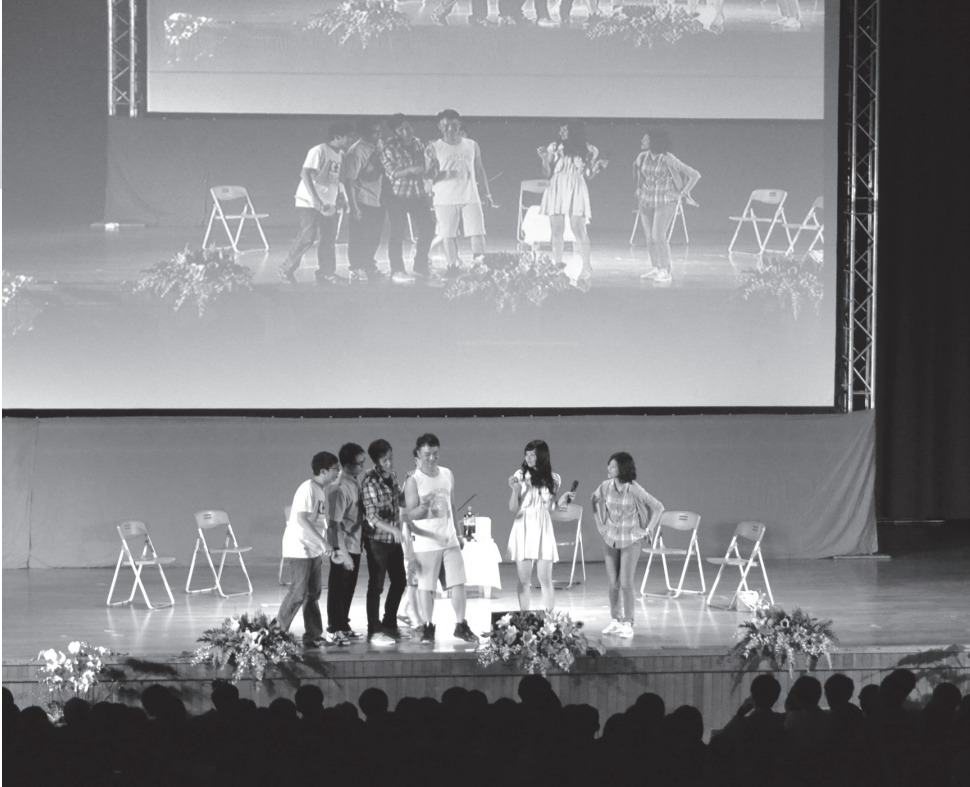
▲「青春歲月」戲劇演出。

認識「無限生命」的特徵，讓我的生活有了改觀，就像整個世界被我看得更寬廣、更全面，不再局限於眼前的事物。了解到眼前所做的一切