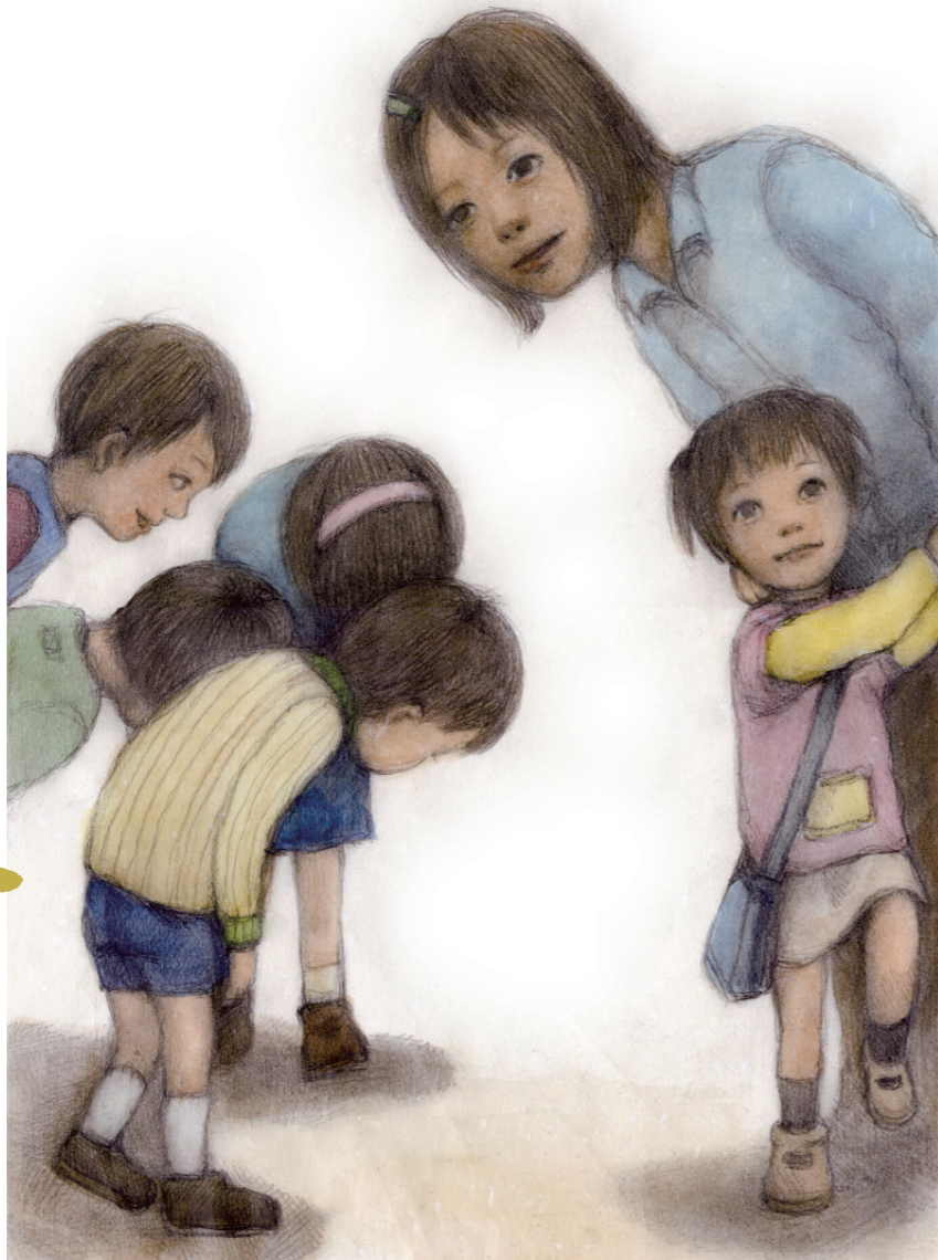
圖 / 蘇麗雲 · 插畫 / 曾淑惠