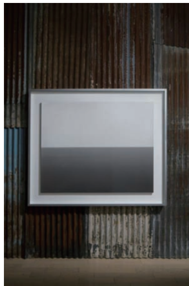
(Lost Human Genetic Archive)

一步入〈Lost Human Genetic Archive〉部分，就置身於整個大型廢墟的裝置之中。眼前是藝術家一件重要作品〈海〉，附上的文字指出海洋孕育了地球上的所有生命，可是也同時見證著這些生命的崩壞。走過這一小片「海」，正式進入主題部分。藝術家把場地畫分成三十三個廢墟情景的裝置藝術，每段配以「今天的世界死了，或者是明天。」開首的文字，向觀賞者展示他對目前世界的看法。在這三十三個情景中，藝術家以個人攝影作品、收藏品、博物館借來的歷史物件，回應各種題目包括了生態、戰爭、慾望、歷史、醫療等。時而真實，時而想像，時而幽默，時而認真，構成一整串絕望風景。這部分的終結時，再展出一幅〈海〉，註解指出在時間長河中，七千年人類文明對海洋來說只是轉眼的一瞬。對，無論人類文明怎樣，對地球、對海洋來說，一切依然。