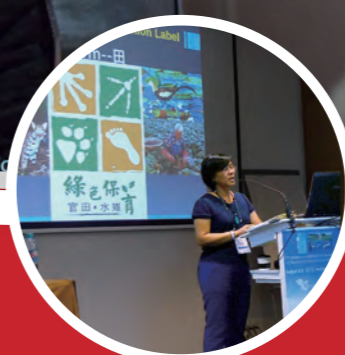
慈心 法國國際論壇