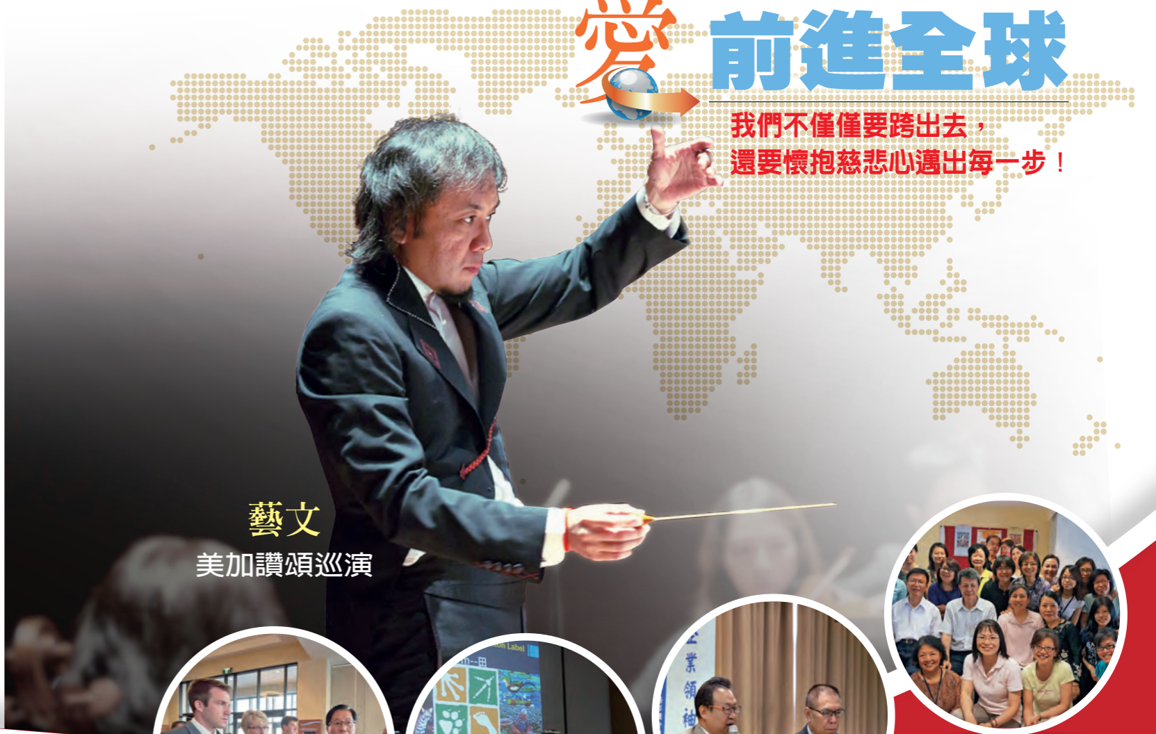
藝文 美加讚頌巡演