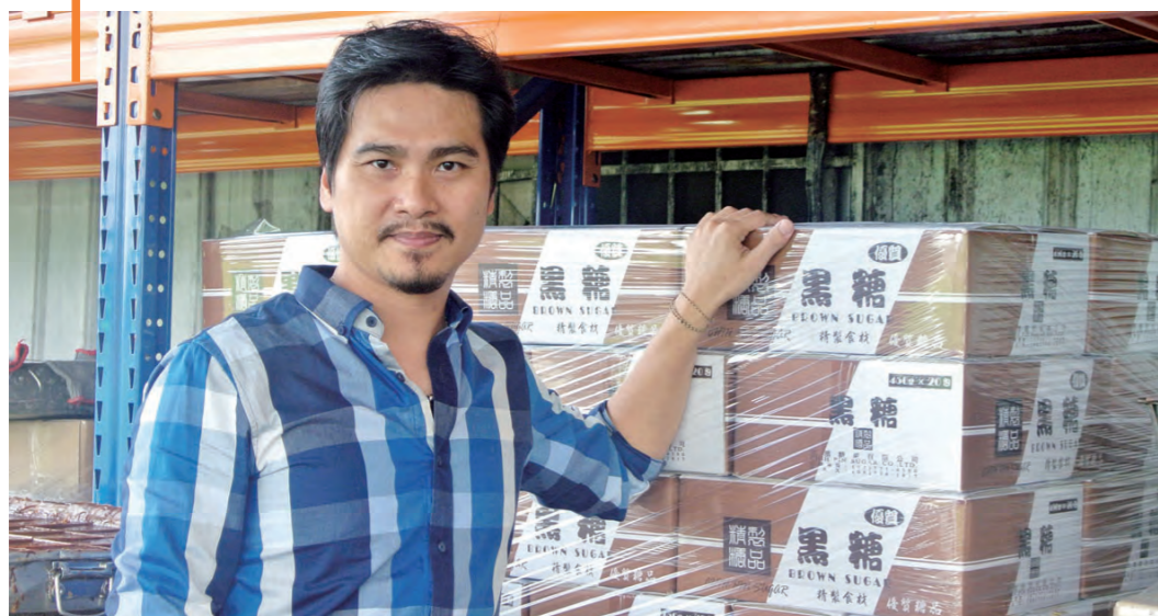
▲本著良心經營事業，三寶必定回饋更多。

一腳踏入製糖業，不久即被化學添加物的神奇所迷惑，在淹沒於滾滾財源前，慶幸遇到生命中的貴人——師父，澈悟今是昨非，安然度過食安風暴危機。