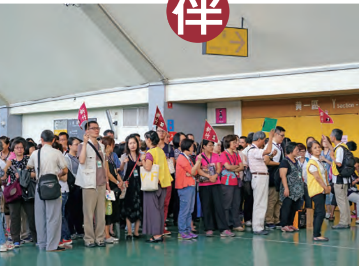
▲排隊等待入場，內心是喜悅、期待的。

我們對於地球，對於人類，甚至對於所有的生命，都有一種與生俱來的責任感。上師說：「即便我只有螢火微光，還是希望能夠把它奉獻出來，能夠溫暖這個世界。」