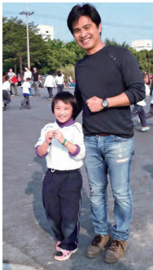
▲長期提供園區糖品，為家人積福。