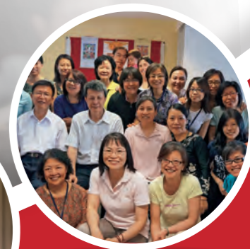
淨智 德國 「歐洲二日營」