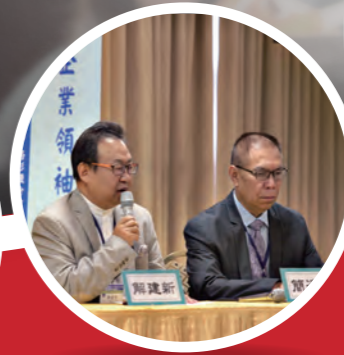
文教 美國三場企業營