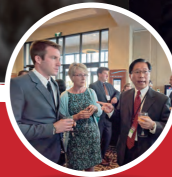
里仁 加拿大產銷情