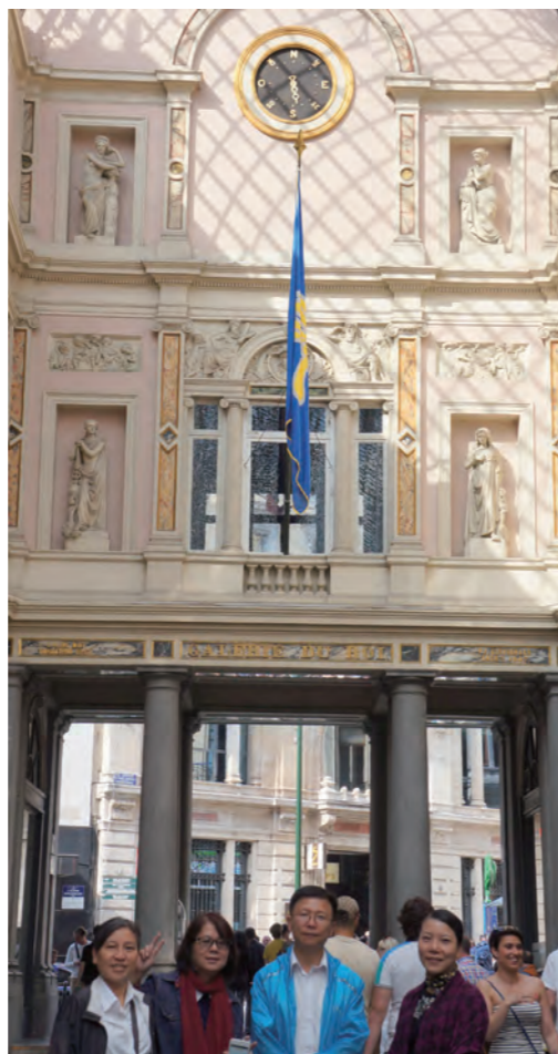
▲歐洲廣論班台灣護持團隊。