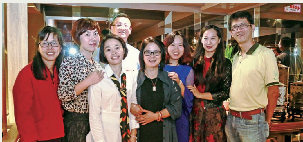
▲作者(右)與友人合影。