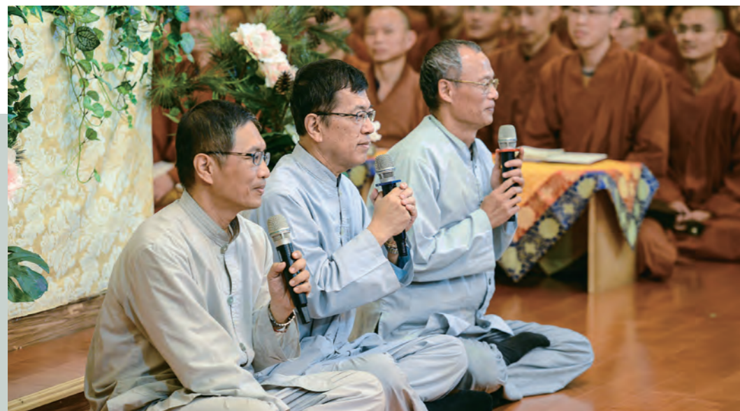
▲學員於結業式集體做了一場辯論供養，上師嘉許居士精進好學的態度。

據所學，集體做了一場辯論供養，更讓上師欣喜於居士精進好學的態度，特別提及未來還會有短期課程，於不同地點舉辦，讓想學的人都有機會學習。