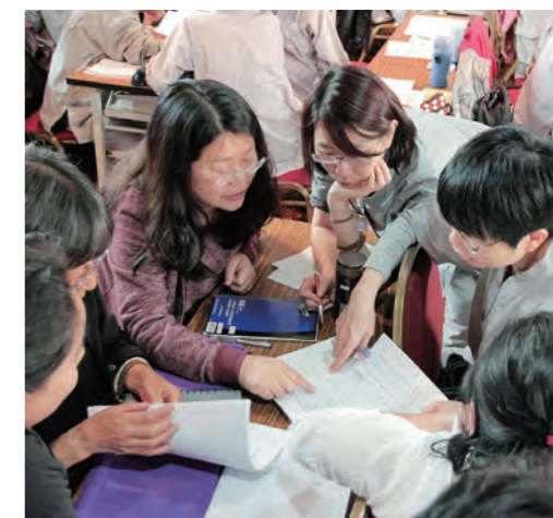
▲依止法是掌握修行的根本命脈。

無數修行者按此修法快速地證得殊勝果位。掌握了道次第，就掌握了成佛的藍圖。道次根本是依止法，依止法根本是修信念恩。對具緣善知識的一切示現，決斷要修信，是爲掌握修行的根本命脈。《菩提道次第心傳錄》作者朗忍巴大師說：「依止法貫穿生命線，修依止法得成就者比比皆是。」想起師父的遺教，但願衆生皆能依上師善巧的口訣教授，迅速破除心中違品，成就依止法，讓三主要道有如探囊取物一樣！