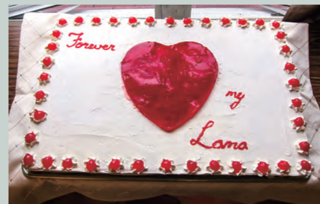
▲紅白大蛋糕寓意攝類學第一章「紅白顏色」，令全場師生俱歡。