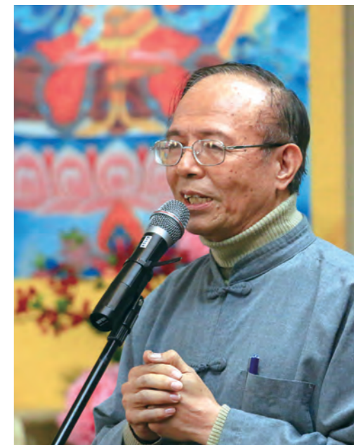
現任南華大學校長， 曾任教育部次長

上師，在座的各位法師、各位同修：今天這個場合，內心非常感動，因為居士佛學院這個創舉不只是我們福智團體歷史的一個轉捩點，甚至是我們佛教界往前邁進一大步的一個根基。所以我剛才一直在私底下談到，今天這個大日子要非常感謝上師，當然最主要剛開始是常師父過去的心願，而上師用師父過去的努力帶領大家突破許多相關的境界。所以要恭喜福智團體、恭喜佛教界，同時也要恭喜在座的各位，能夠在百忙當中、克服困難的資具來學這五部大論。我相信將來在座各位同修學成之後，不只是福智團體，對佛教界會開拓另外一個里程碑。恭喜大家，祝大家一切能夠順利圓滿。大家好好努力，也要感謝上師給我們這個機會，也感謝幾位法師非常地辛苦，把相關的藏文翻譯成中文，讓大家學習能夠更快速成長。