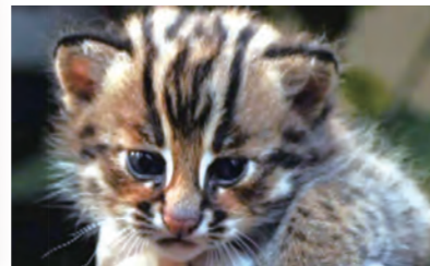
同屬貓科的石虎（上）和家貓（左），比比看哪裡不一樣？