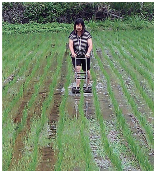
▲▼石虎體驗營，新鮮農村樂。